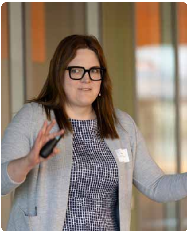
Netzwerk-Apéro vom 7. April 2025