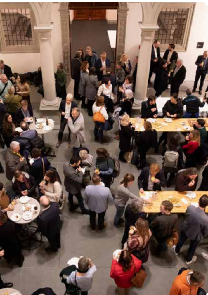
Podiumsveranstaltung vom 12. Februar 2025

Nach diesem Abend ist es klar: Die Zukunft der Gesundheitsversorgung in der Zentralschweiz hat schon begonnen. Zu diskutieren gibt es natürlich noch einiges: Am Apéro riche, fachmännisch zubereitet und serviert von der IG Arbeit, ist der Lautpegel hoch, Gespräche und Austausch sind in vollem Gang.