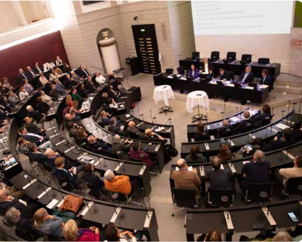
Podiumsveranstaltung vom 12. Februar 2025