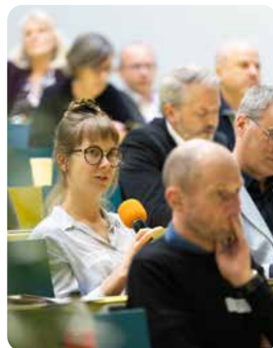
Luzerner Kongress Gesellschaftspolitik, 27. November 2025