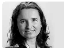
Yvette Estermann Nationalrätin SVP