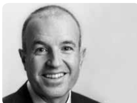
Roland Fischer Nationalrat GLP