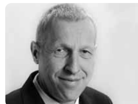
Konrad Graber Ständerat CVP