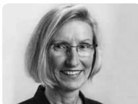
Prisca Birrer-Heimo Nationalrätin SP