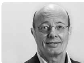
Louis Schelbert Nationalrat Grüne