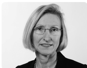
Prisca Birrer-Heimo Nationalrätin SP/LU