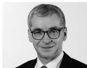
Erich Ettlin Ständerat CVP/OW